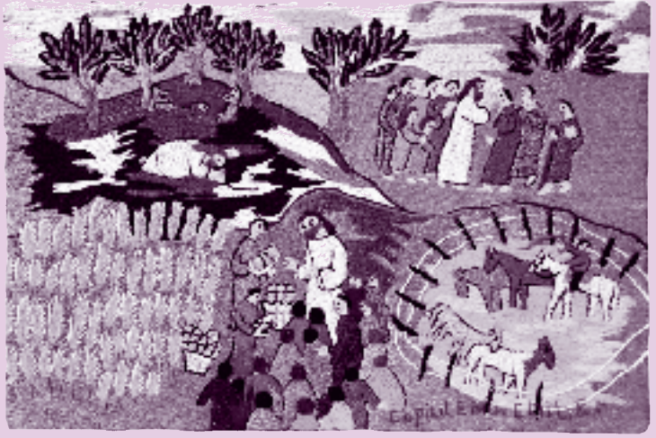
Eine Stickerin in Chile hat das offizielle Bild zum Weltgebetstag gestaltet. Wie viele Brote habt ihr? - Las Bordadoras de Copiulemu.