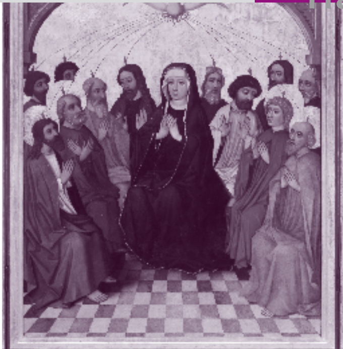
Ausgießen des Heiligen Geistes. 15. Jahrhundert Nürnberg, jetzt Köln.