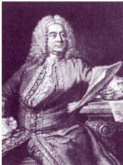
Georg Friedrich Händel

Messias von Georg Friedrich Händel. Mit den VoicES aus Esslingen und dem Liederkranz Steinenbronn. Sonntag, 16. Mai, 16.30 Uhr im Münster St. Paul Esslingen, Einlass ab 16.00 Uhr. Eintritt 15,-€/12,-€.