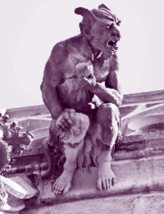
Wasserspeier an der Frauenkirche