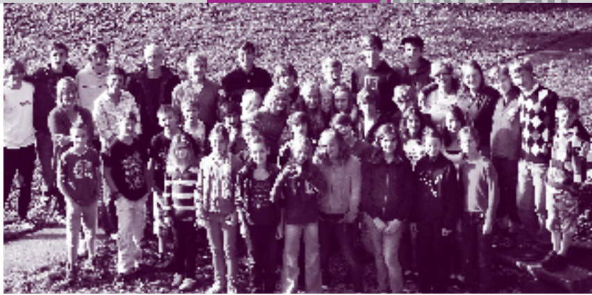
Jungcharfreizeit 2010 auf der Schwäbischen Alb