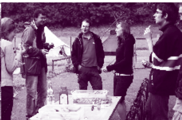
Gemeinschaft, Spiel und Spaß - CVJM Jungscharfreizeit auf der schwäbischen Alb

Nikoläuse mitten im Sommer. Die Geburt eines Kalbes. Erlebnisse auf Jungscharfreizeiten des CVJM Sulzgries aus den vergangenen Jahren. Und wieder sind 32 Mädchen und Jungen im Alter von neun bis 14 Jahren zu einer Jungscharfreizeit angemeldet. Diesmal in Radelstetten auf der Schwäbischen Alb.