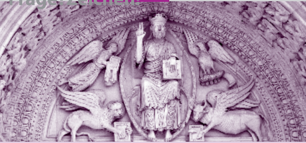
Segnender Christus; Arles, romanisch