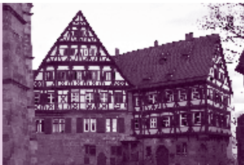
Der Speyerer Pfleghof, der von 1213 bis 1547 zum Domkapitel in Speyer gehörte (heute: Kesslerhaus)