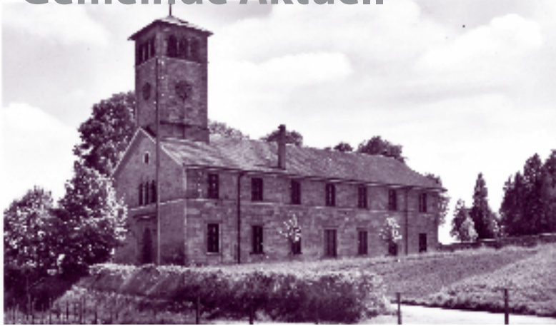
Die Sulzgrieser Kirche um 1952