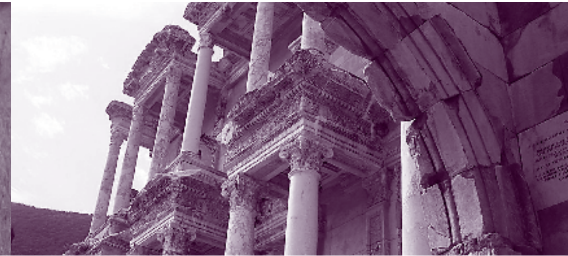
Die Celsus Bibliothek in Ephesus