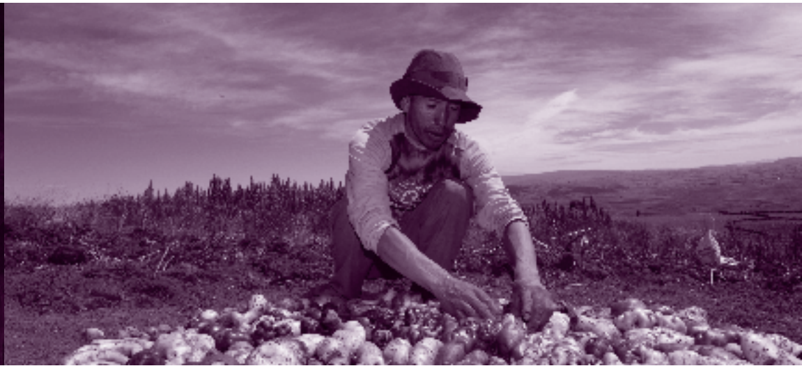
Kartoffelernte in Peru.