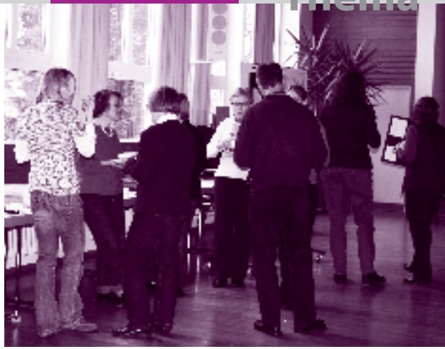
Ideen und Diskussion. Die Gemeinde hat Leitlinien entwickelt.

„Gemeinde auf dem Weg ...“, so sind die Leitlinien für die Kirchengemeinde Sulzgries überschrieben. In einem Leitbildprozess, der von zwei erfahrenen Moderatoren des Evangelischen Gemeindedienstes begleitet wurde, hat der Kirchengemeinderat die Leitlinien erarbeitet und nun verabschiedet. Ein Druckexemplar ist diesem Gemeindebrief beigefügt.