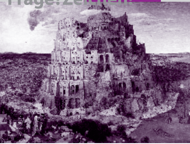
Für Gott winzig klein: Der große Turm zu Babel - Pieter Breugel, der Ältere; 1563