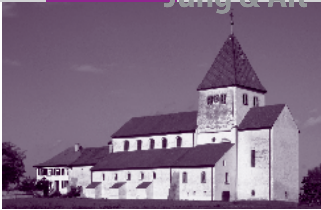
Kirche St. Georg, Reichenau-Oberzell