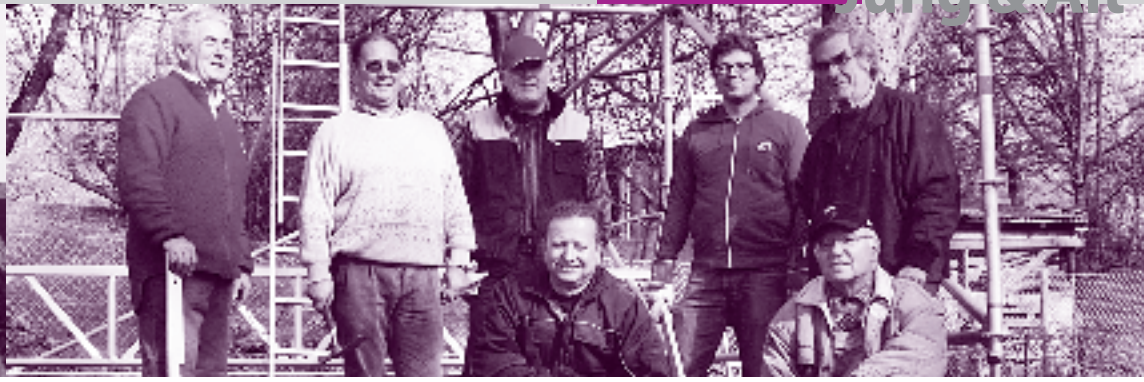
Fußballexperten am Bau: Das neue Gerüst