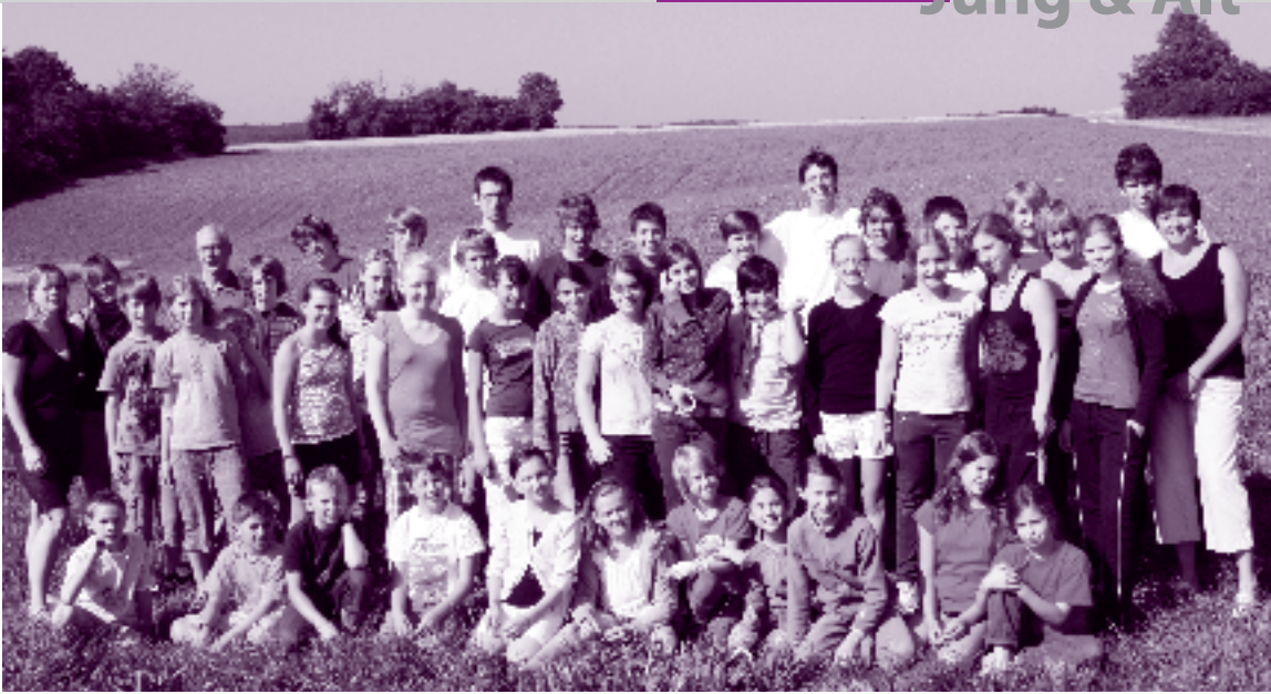
Die Kinder und Betreuer der Jungcharfreizeit in Radelstetten