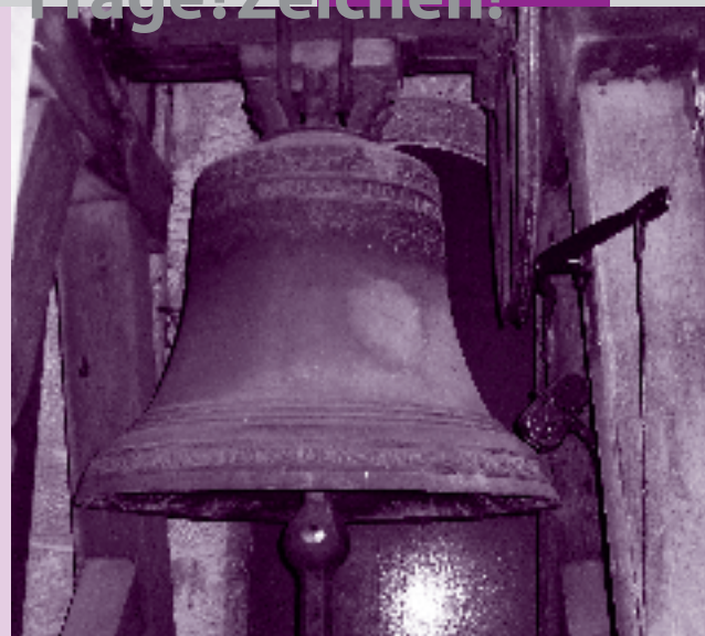
Glocke von 1665, Kirche Sulzgries