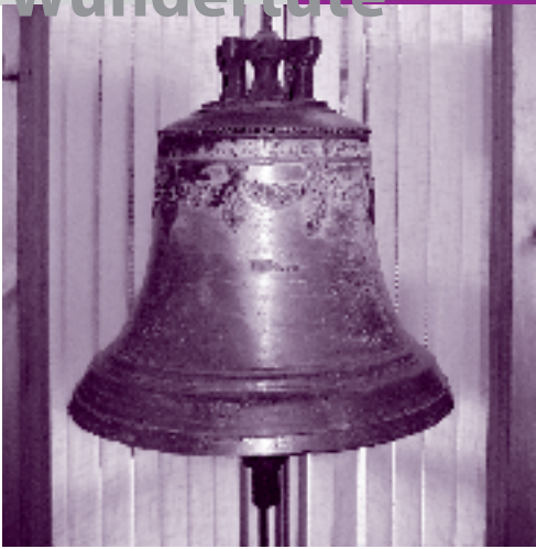
Die Rüderner Glocke von 1849