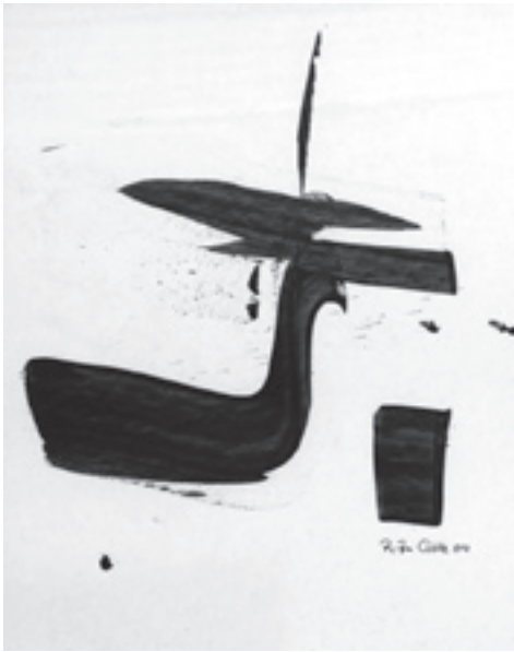
Rita Götz: Ohne Titel