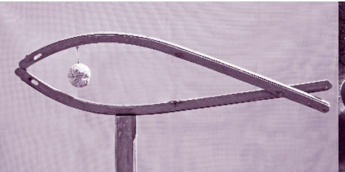
Rita Götz: Fisch