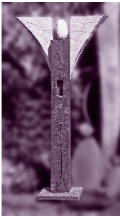
Rita Götz: Tragende Flügel