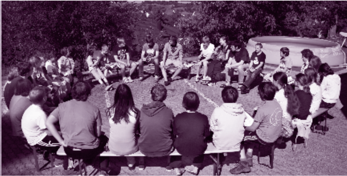
Jungscharfreizeit 2011 in Sulz am Neckar