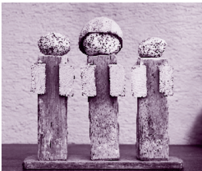
Rita Götz: Die Drei