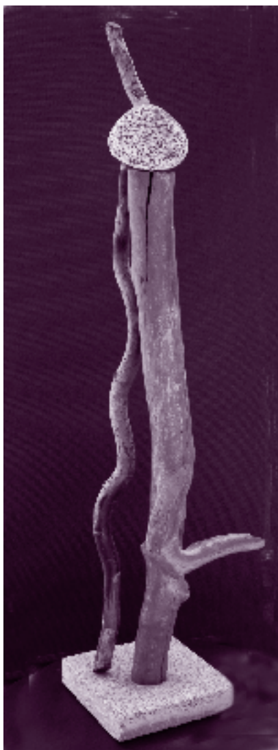
Rita Götz: Schwieriges Laufen